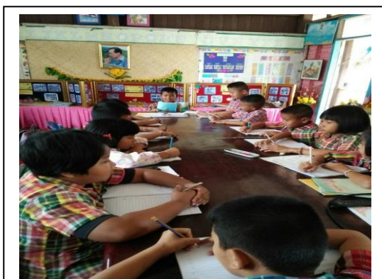
รุ่นพี่อาสาสมัครมาช่วยสอนหนังสือ

ภาพกิจกรรม การพัฒนาทักษะการอ่านออกเขียนได้ของนักเรียน ตามรูปแบบการนิเทศครู เพื่อพัฒนาทักษะการอ่านออกเขียนของนักเรียนชั้นประถมศึกษา