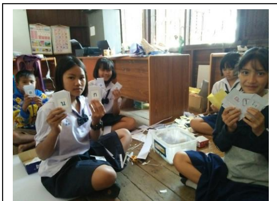
พี่ๆ ช่วยกันสร้างสื่อให้น้องๆ