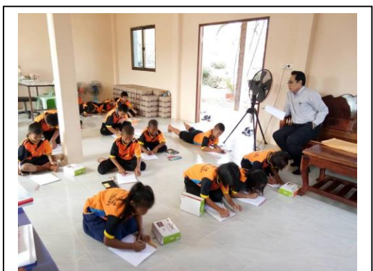
ทดสอบ การอ่านเขียนเป็นระยะๆ