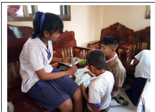
พี่ช่วยน้อง อ่านเขียนเป็นรายบุคคล