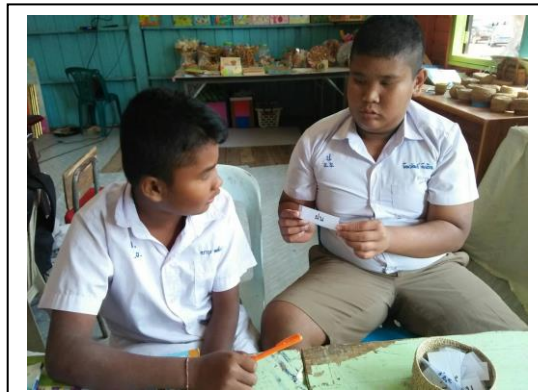
เพื่อนช่วยเพื่อน อ่านเขียนจากบัตรคำ