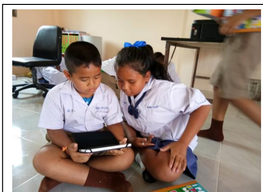
ฝึกอ่านเขียนจากแท็บเล็ต